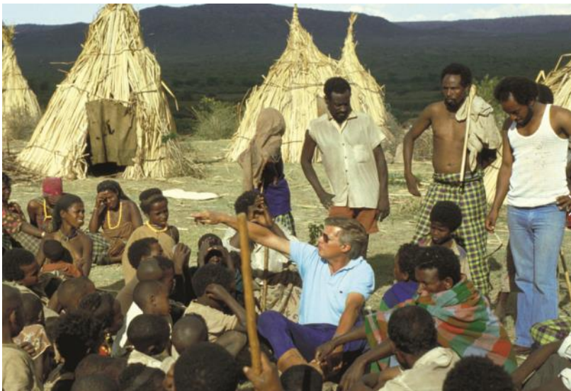
Karlheinz Böhm zu Beginn seiner Arbeit mit Menschen für Menschen in Äthiopien.